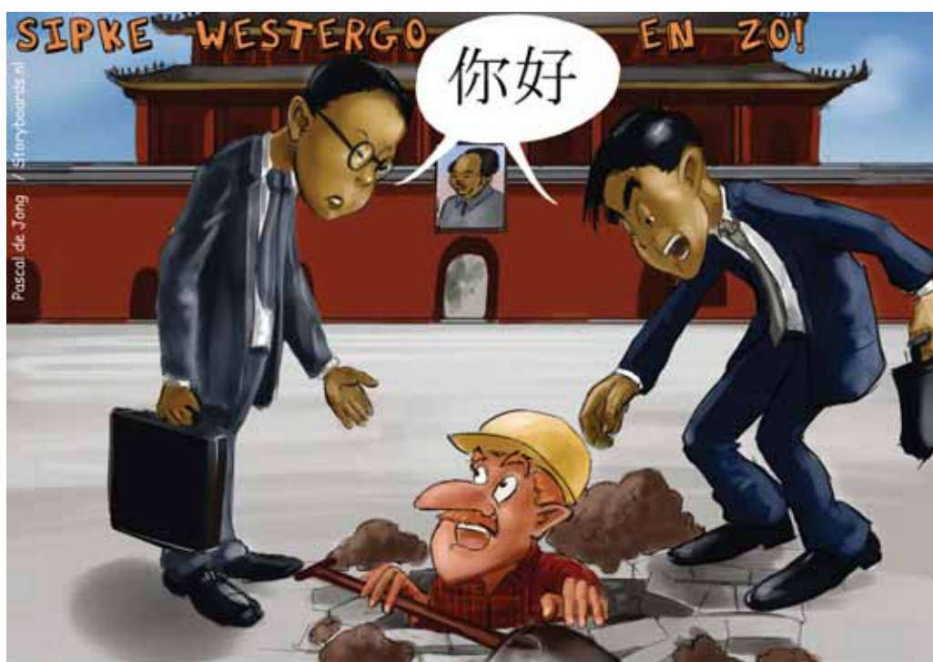
"Op zoek naar aardwarmte !"

Lees op www.westergozone.nl het tweede deel van het interview.